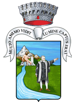
Comune di Taglio di Po